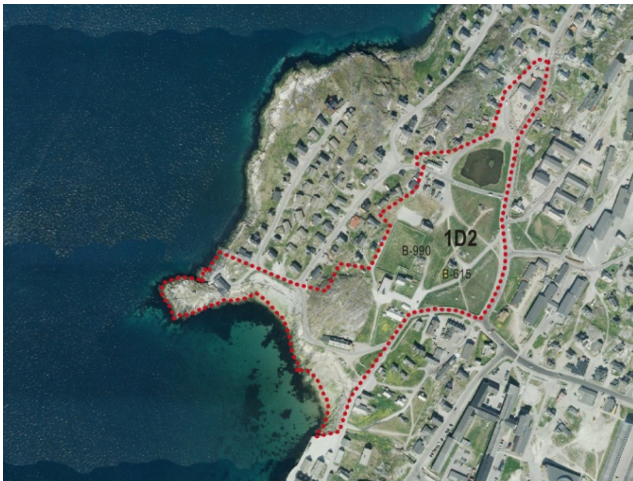
Figur 1) Immikkoortup ilaata killeqarfilersorneqarnera

Kommunimut pilersaarummut tapiliussami nunaminertaq 7, 0 ha.-it missaanni annertussuseqarpoq, figur 1 takuuk.